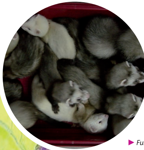
► Furetons de 7 semaines.