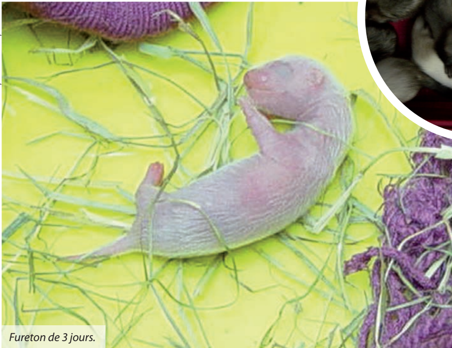
Fureton de 3 jours.